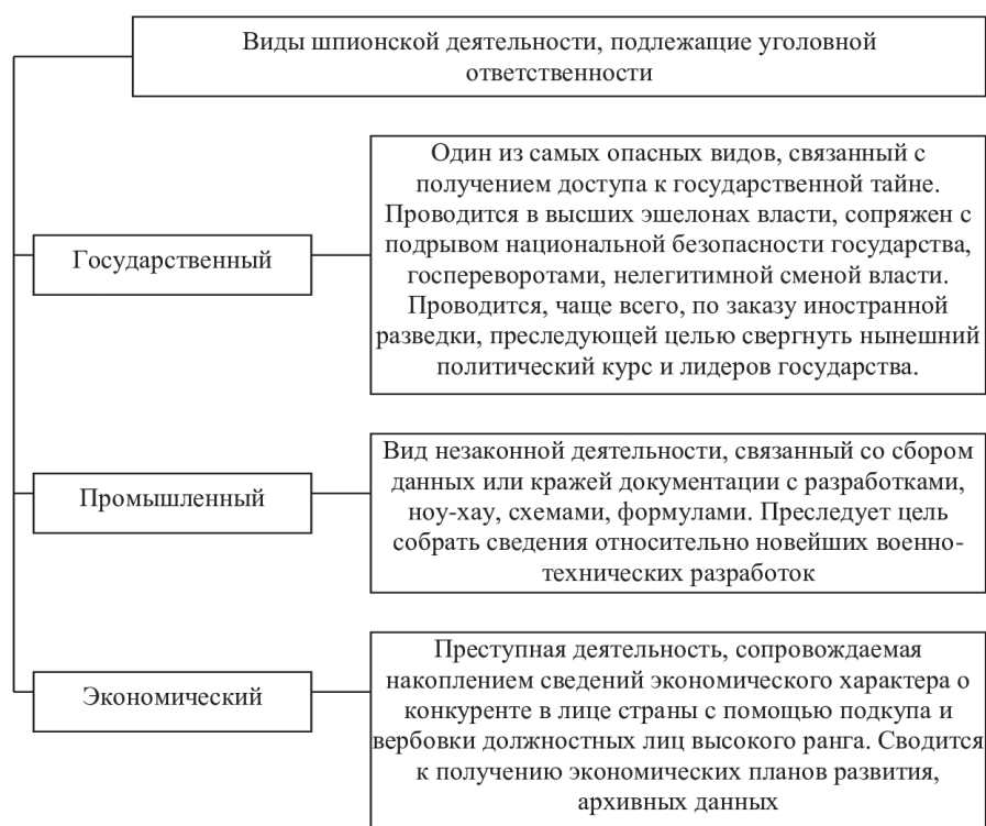
Рис. 1. Виды шпионской деятельности, образующие состав преступления государственная измена (составлено автором).

В настоящее время распространенными являются следующие виды шпионажа, которые подлежат уголовной ответственности (рис. 1).